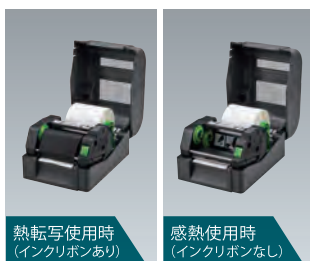
熱転写使用時 (インクリボンあり)

熱転写印刷が可能なので、紙素材だけでなく、耐久性の高いフィルム素材のラベルにも印刷できます。また、インクリボンを取り外して感熱ラベルを装着することで、感熱印刷にも対応します。