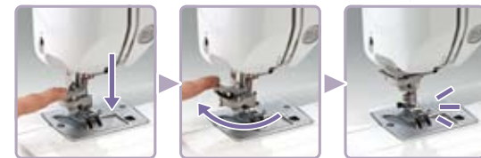
1.レバーを下げて 2.押して戻せば 3.できあがり!

らくらく糸通し 難しかった針穴への糸通しも「糸通し装置」がついているから、手間なく指1本でカンタンにできちゃうのがスゴイ!